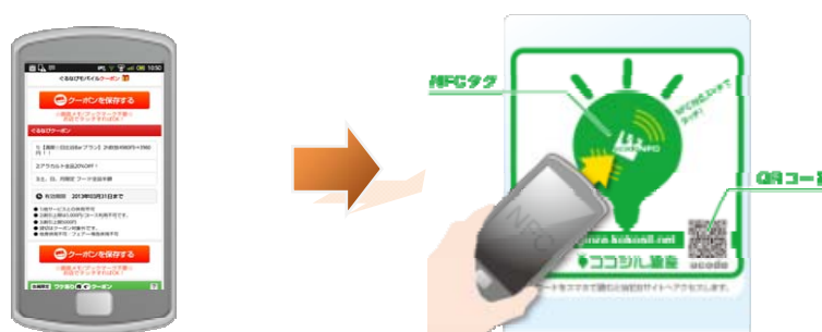
ブックマークしたクーポンを表示させて タグにタッチしてクーポンを利用