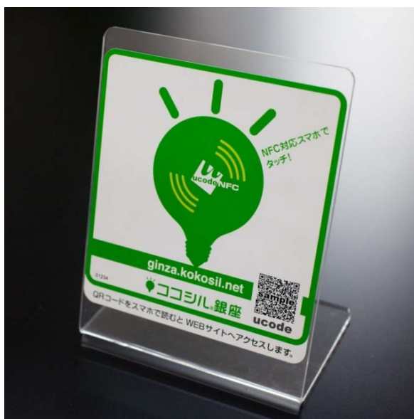
ココシル店舗 (ucodeNFC) タグ