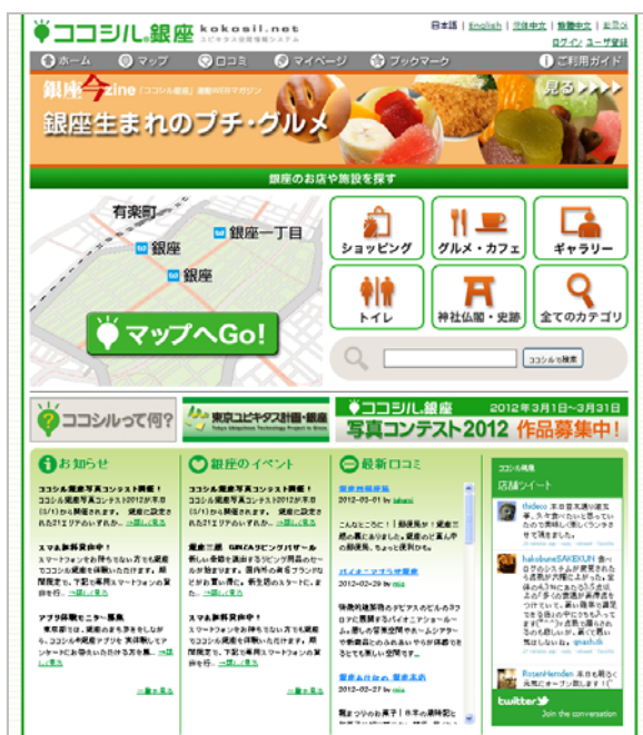
図1：「ココシル銀座」PC サイト

コンテスト参加者がデジタルカメラで写真を撮影した場合は、PC等に写真を取り込んだ後、ココシル銀座サイトから写真を投稿することができます（この場合はデジタルカメラ部門としてエントリーされます）。スマートフォンの場合は、スマートフォン用アプリを利用することで、銀座の街にいながらにして簡単に投稿することができます（スマートフォン用アプリから投稿した場合、スマートフォン部門としてエントリーされます）。