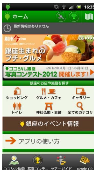
図2：スマートフォンアプリ画面

スマートフォン用アプリでは、今いる場所を自動的に認識し、そのエリアから応募された写真を閲覧したり、閲覧している写真に投票したりすることができます。